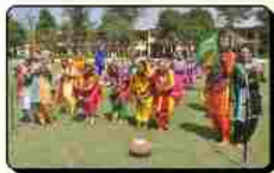
ਸੱਭਿਆਚਾਰਕ ਪ੍ਰੋਗਰਾਮ ਦੌਰਾਨ ਗਿੱਧਾ ਪੇਸ਼ ਕਰਦੀਆਂ ਹੋਈਆਂ ਵਿਦਿਆਰਥਣਾਂ