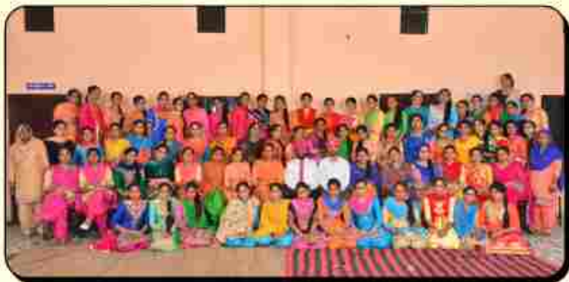
ਵਿਦਿਆਰਥੀ ਖਾਰਟੀ ਸਮਾਗਮ ਦੌਰਾਨ ਬੀ.ਏ. ਭਾਗ ਤੀਜਾ ਅਤੇ ਬੀ.ਸੀ.ਏ. ਭਾਗ ਤੀਜਾ ਦੀਆਂ ਵਿਦਿਆਰਥਣਾਂ ਕਾਲਜ ਪ੍ਰਿੰਸੀਪਲ ਅਤੇ ਸਟਾਫ ਨਾਲ