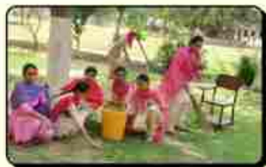
ਐਨ.ਐਸ.ਐਸ. ਦੇ ਰੌਪ ਦੌਰਾਨ ਕਾਲਜ ਵਿਖੇ ਸਫਾਈ ਕਰਦੀਆਂ ਹੋਈਆਂ ਵਿਦਿਆਰਥਣਾਂ